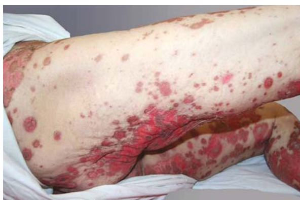
Rycina 1. Stan miejscowy przy przyjęciu do Kliniki – koncentryczne plamy i grudki rumieniowo-obrzękowe przypominające kształtem tarczę strzelniczą

W badaniach immunologicznych surowicy wykazano przeciwciała przeciwjądrowe (ANA) w mianie 640, o typie świecenia homogennym i plamistym, przeciwciała ds-DNA w mianie 160 oraz przeciwcia-