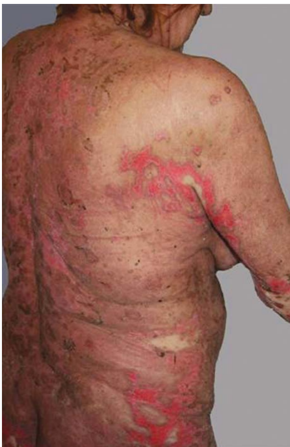
Rycina 4. Stan poprawy (trzecia doba terapii IVIG) widoczne cechy epitelizacji Figure 4. Improvement of skin lesions (3 rd day of IVIG therapy) – beginning of epithelisation

ła przeciwko histonom i nukleosomom. Nie stwierdzono natomiast przeciwciał pemphigus i pemphigoid . Wykonane próby świetlne z promieniowaniem UVA, UVB i UVB 311 były ujemne.