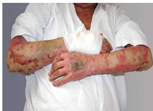
Rycina 2. Stan miejscowy przy przyjęciu do Kliniki – symetrycznie rozmieszczone zlewne ogniska rumieniowo-nadżerkowe