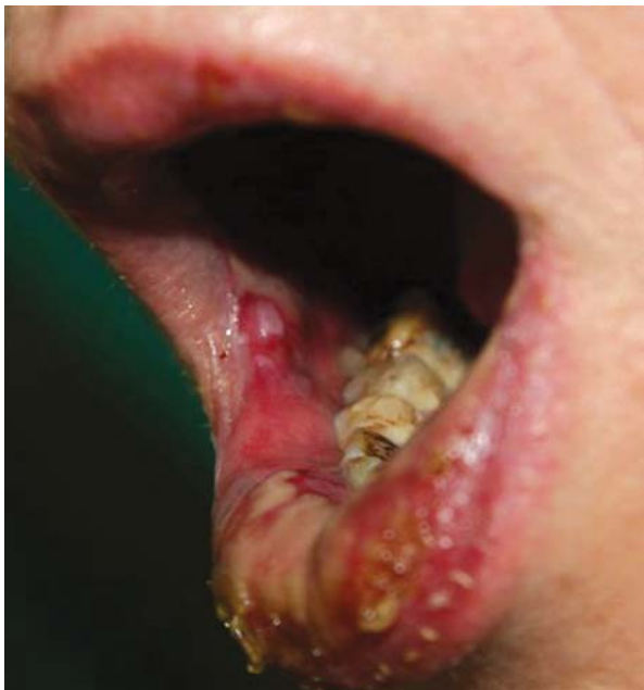
Rycina 3. Niegojące się nadżerki błon śluzowych jamy ustnej, pokryte surowiczo-ropną wydzieliną Figure 3. Erosions on buccal mucosa with serous and purulent exudate